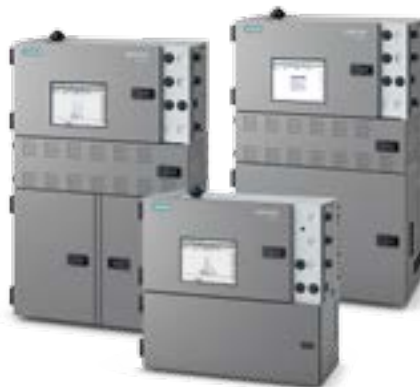
Prozess-Gaschromatograph MAXUM Edition II.