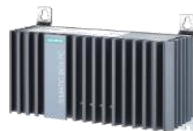
ウォールマウント