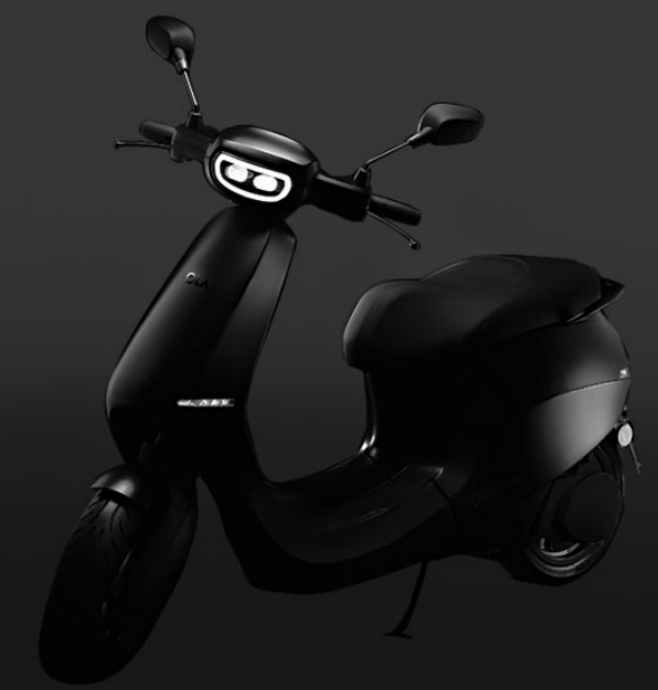
PAVAN LALL Mumbai, 12 May

It aims to become a game changer in electric two-wheelers and is building up expectations with some high-profile moves