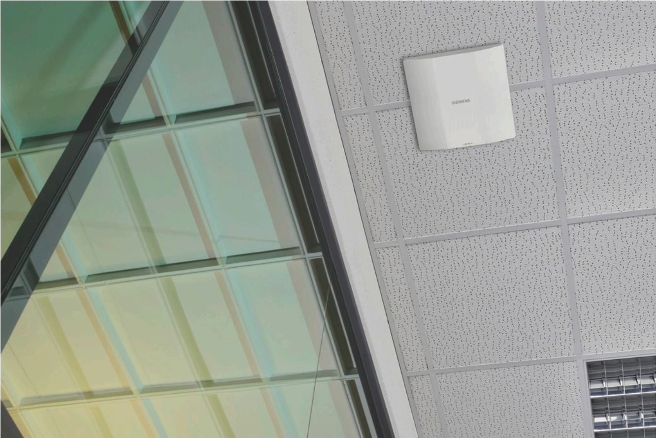
Einfache Montage, modernes Design – Direct-AP Scalance W1750D-2IA RJ45

Auch das Design sorgt dafür, kleinere und mittlere WLAN Installationen kostengünstig und einfach zu realisieren – durch das moderne und ansprechende Design sind die Geräte für eine sichtbare Montage in industrienahen Büroräumen oder sauberen Montagehallen prädestiniert. Das leichte Gewicht und die einfache Befestigung an den Schienen abgehängter Leichtbaudecken sorgen für eine flexible Anbringung genau dort, wo ein Access Point benötigt wird. Egal ob in der Werkskantine, dem offenen Warenlager oder Meisterbüros – überall ist ein Direct Access Point einfach und flexibel zu nutzen.