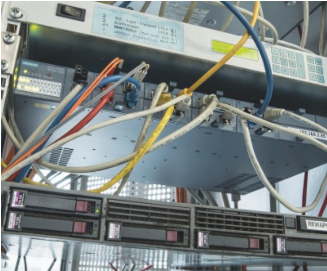
Neun vollmodulare managed Industrial Ethernet Switches SCALANCE XR324-12M von Siemens bilden einen performanten und zuverlässigen Backbone in der Profilproduktion.