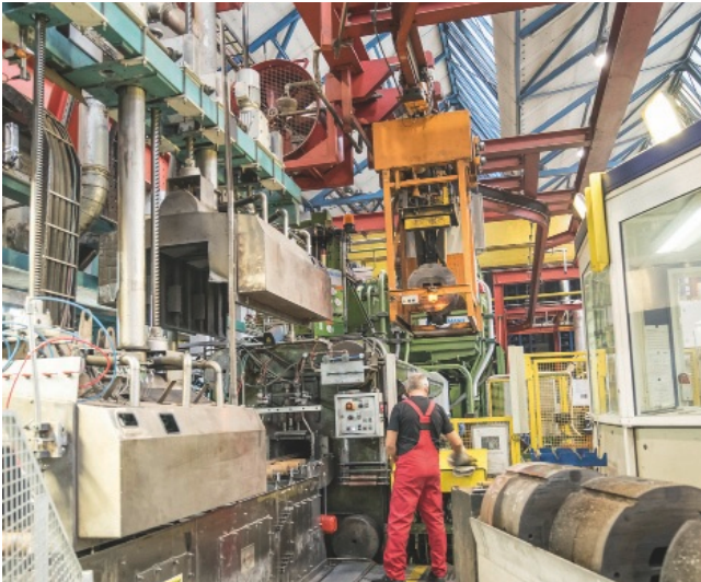
Auf zwei Strangpressen fertigt Sapa Extrusion Deutschland im Werk Rackwitz hochwertige Aluminiumprofile für unterschiedlichste Anwendungen, veredelt und bearbeitet diese.

Im Rahmen der CE-Zertifizierung seiner Erzeugnisse hat Sapa bestimmte Produktionsbedingungen im Werk überprüft. Dabei wurde gemeinsam mit den Fachberatern von Siemens, dem langjährigen Ausrüster des Herstellers für Elektro- und Automatisierungstechnik, auch ein sogenannter Security Quick-Check durchgeführt. Generell sollte damit die Verfügbarkeit des gesamten Netzwerkes untersucht werden, um das Risiko potenzieller Systemausfälle zum Beispiel durch Cyber-Attacken auf die Produktionssysteme beurteilen zu können. Die Security-Analyse hat dann ergeben, dass die Industrietauglichkeit einzelner Netzwerkkomponenten sowie der Zugriffsschutz auf Switches, PCs, Steuerungen und Kommunikationsprozessoren im Feld optimiert werden kann. Ebenso verhält es sich im Bereich der fehlersicheren Kommunikation beim Betrieb dreier Laufkatzen für den Transport von Presswerkzeugen und Schrott. Daraufhin wurden konkrete Maßnahmen abgeleitet, zusammen mit dem Ausrüster praktikable Lösungen erarbeitet und teilweise schon umgesetzt.