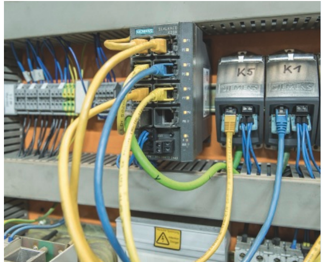
Zum Teil sind die Netzwerkteilnehmer über unterlagerte managed Switches SCALANCE X-200 in den Schaltschränken an den Backbone angebunden.

Die aktuell rund 200 relevanten Teilnehmer im Feld sind zum Teil direkt, zum Teil über unterlagerte managed Industrial Ethernet Switches der Baureihe SCALANCE X-200 in dezentralen Schaltschränken an den Backbone angebunden. So ist produktionsweit horizontal und vertikal durchgängig robuste und zuverlässige Kommunikation gewährleistet.