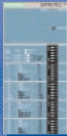
Autoalimentado pelo TC SIPROTEC easy (7SJ45)