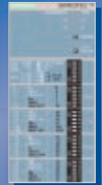
Alimentação através de tensão auxiliar (7SJ46)