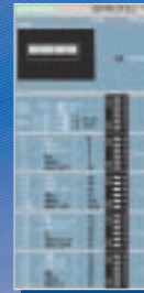
SIPROTEC easy (7SJ45) Autoalimentado pelo TC, com indicação mecânica de trip