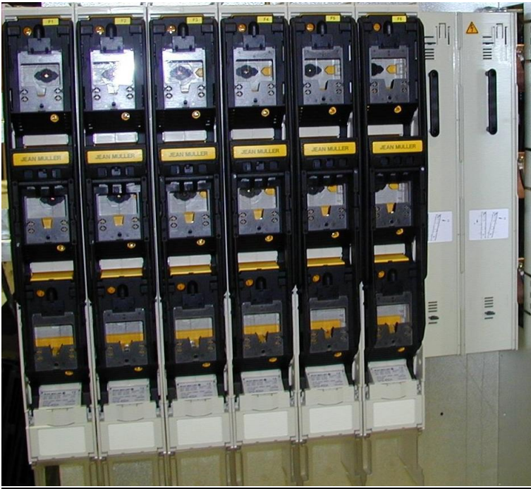
Bilde av tavle

Sikringslister type SL er bygget og testet etter IEC/EN 60439-1 og IEC/EN 60947-3. Sikringslistene produseres av firma Jean Müller i byen Eltville i Rhindalen i Tyskland. Den type sikringslist som her presenteres er 2. generasjons sikringslist bygget etter de nevnte normer.