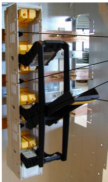
Underdel sikringslist og tomplass

Lås for deksel som ved montering/demontering vrís 90 grader med en flat skrutrekker