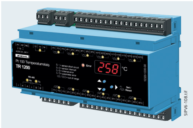
Abb. 13/107 RTD-Box TR1200 7XV5662-6AD10