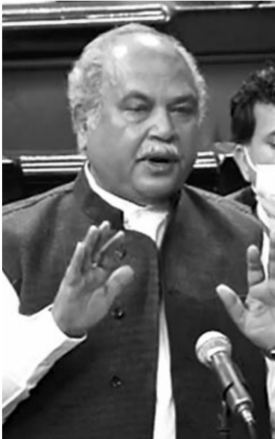
Agriculture Minister Narendra Singh Tomar speaks in the Rajya Sabha during the Budget session of Parliament

Meanwhile, intervening during the motion of thanks to the President's address to both houses of Parliament at