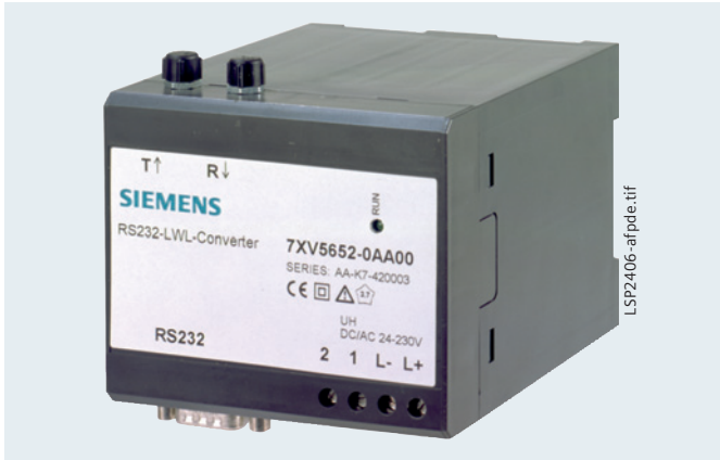
Abb. 13/57 RS232 – LWL-Konverter