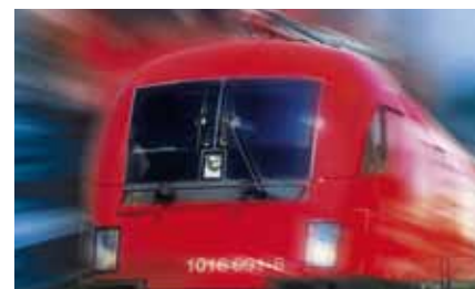
Die elektrische Lokomotive Rh1016 der ÖBB.

So gesehen stehen die Integrated Services ganz im Dienste des Return on Investment und des Investitionsschutzes unserer Bahn. Sehr gerne zeigen wir Ihnen, was das konkret für Ihr Unternehmen bedeuten kann, und heissen Sie herzlich willkommen bei Siemens.