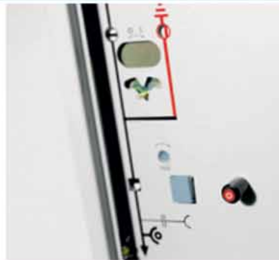
Распределительное устройство NXPLUS до 40,5 кВ, до 31,5 кА, до 2500 А