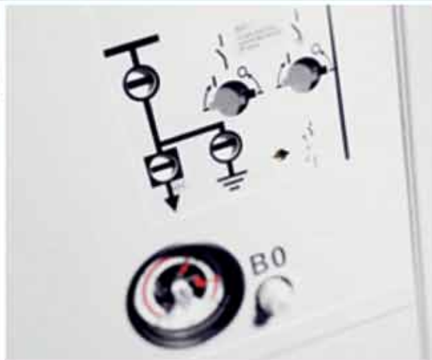
Распределительное устройство 8DA10 до 40,5 кВ, до 40 кА, до 5000 А