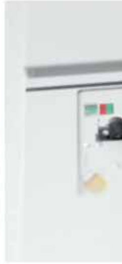
Распределительное устройство типа 8DJH до 24 кВ, до 20 кА, до 630 А до 17,5 кВ, до 25 кА, до 630 А