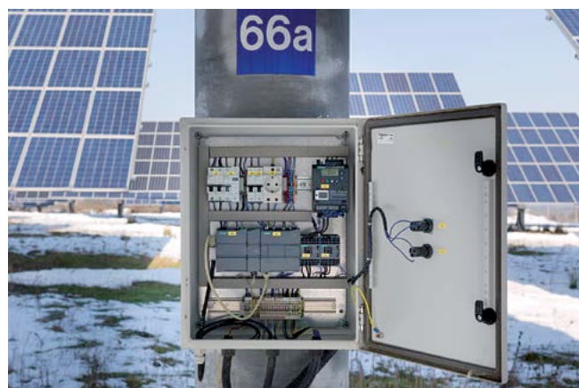
Schaltschrank am Mast

Die Informationen in dieser Broschüre enthalten lediglich allgemeine Beschreibungen bzw. Leistungsmerkmale, welche im konkreten Anwendungsfall nicht immer in der beschriebenen Form zutreffen bzw. welche sich durch Weiterentwicklung der Produkte ändern können. Die gewünschten Leistungsmerkmale sind nur dann verbindlich, wenn sie bei Vertragsschluss ausdrücklich vereinbart werden. Alle Erzeugnisbezeichnungen können Marken oder Erzeugnisnamen der Siemens AG oder anderer, zu liefernder Unternehmen sein, deren Benutzung durch Dritte für deren Zwecke die Rechte der Inhaber verletzen kann.