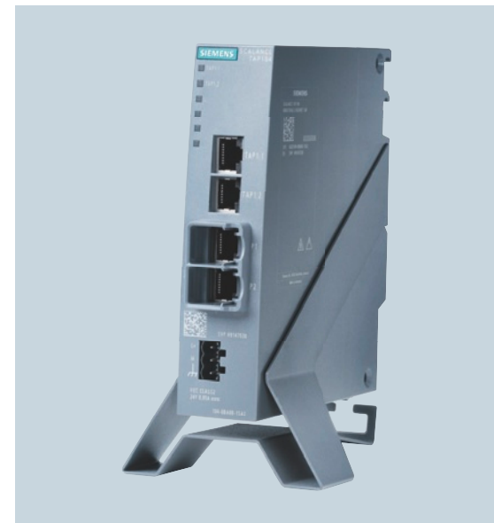
Einfache vorübergehende Installation von Scalance TAP104 zur Datendiagnose in einem Netzwerk mit Tischfuß

Alle Erzeugnisbezeichnungen können Marken oder Erzeugnisnamen der Siemens AG oder anderer, zuliefernder Unternehmen sein, deren Benutzung durch Dritte für deren Zwecke die Rechte der Inhaber verletzen kann.