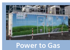
Power to Gas