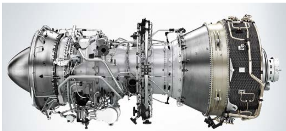
Motor principal clase 45-MW derivado del Industrial Trent 60

Nota: Se muestra el desempeño Nominal. Las garantías de desempeño solo se proporciona en propuestas individuales de proyecto basados en las especificaciones proporcionadas. El desempeño nominal mostrado referido a nivel del mar, 60% de humedad relativa, combustible gas natural, cero pérdidas en la instalación.