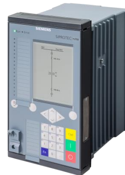
Transformator-differentialschutz SIPROTEC 7UT82 (1/3 Gerät = Standardvariante W1)