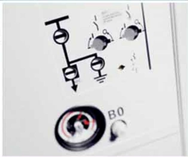
Распределительное устройство 8DA10 до 40,5 кВ, до 40 кА, до 5000 А