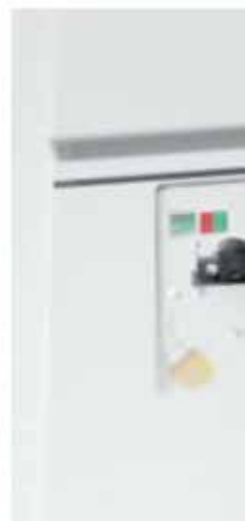
Распределительное устройство типа 8DJH до 24 кВ, до 20 кА, до 630 А до 17,5 кВ, до 25 кА, до 630 А