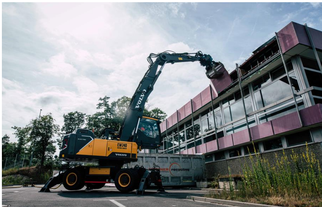
Bild 1: Der Volvo-Umschlagbagger EW240 Electric MH reißt die ersten Panele vom Gebäude ab