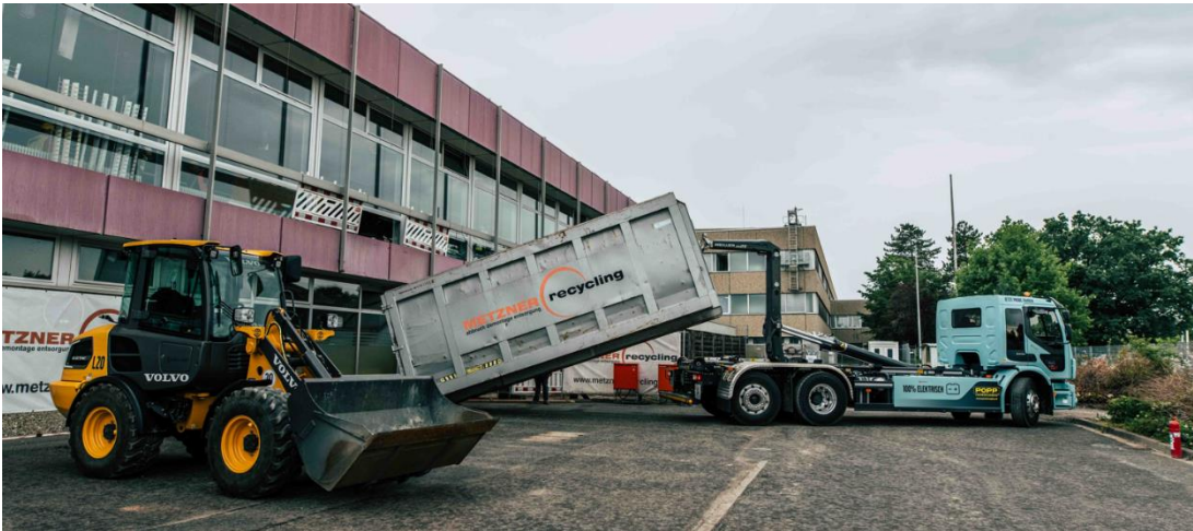
Bild 4: Der Volvo-Radlader L20 Electric übernimmt gemeinsam mit dem Volvo Truck FE 6x2 Electric mit Abrollkipper die Baustellenlogistik.