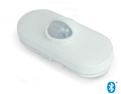
Capteur de surface, USB

Confidentialité des données : Le capteur capture les données occupationnelles dans la zone de couverture du capteur. Le capteur ne peut pas directement référencer ou identifier une personne physique.