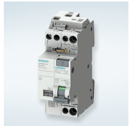
5SV1 kombiafbryder i en 1-moduls bredde (18 mm), som kan kombineres med 5SM6 gnistdetektor