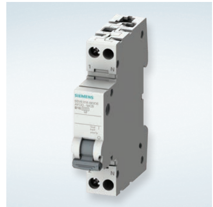
5SV6 automatsikring med indbygget gnistdetektor i kun 1-moduls bredde (18 mm)

Kombinerer man 5SV1 med Siemens 5SM6 gnistdetektormodul har man tilføjet brandbeskyttelse. Dette sker i en 2-moduls bredde (36 mm).