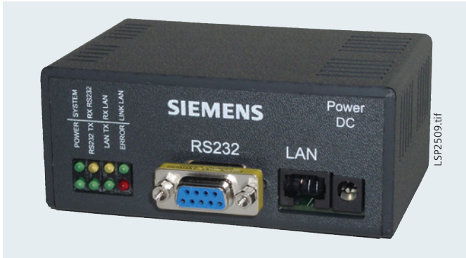
Abb. 13/86 Ethernet-Modem 7XV5850