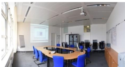
Abbildung 3: RTDS-Besprechungsraum auf dem Siemens AG Gelände in Erlangen

Im Unterschied zu realen Störungen stehen während der Simulation die Informationen über die Fehlerart und Fehlerort vor jedem Testfall zur Verfügung. Auf diese Weise kann die erwartete Kette von Ereignissen und die Reaktion des Schutzsystems mit der tatsächlichen Reaktion des getesteten Systems direkt verglichen werden. Unsere Kunden haben die Möglichkeit, das Verhalten des Netzes und der Relais mit Experten von Siemens PTI zu besprechen. Speziell für diese Zwecke steht ein mit Flipcharts und Projektor ausgestatteter Besprechungsraum zur Verfügung (Abbildung 3).