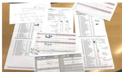
Abbildung 2: Beispiel für die Dokumentation

Das Verhalten der untersuchten Geräte wird für jeden einzelnen Testvorgang mit den gemessenen Relais-Auslösezeiten, weiteren vom RTDS erfassten binären Informationen, den vollständigen Relais-Fehlerprotokollen und Fehleraufzeichnungen (COMTRADE) ausführlich dokumentiert. Für jeden Prüfungsvorgang (Testsequenz) werden die Fehlerprotokolle analysiert und die Fehleraufzeichnungen gründlich ausgewertet (Abbildung 2).