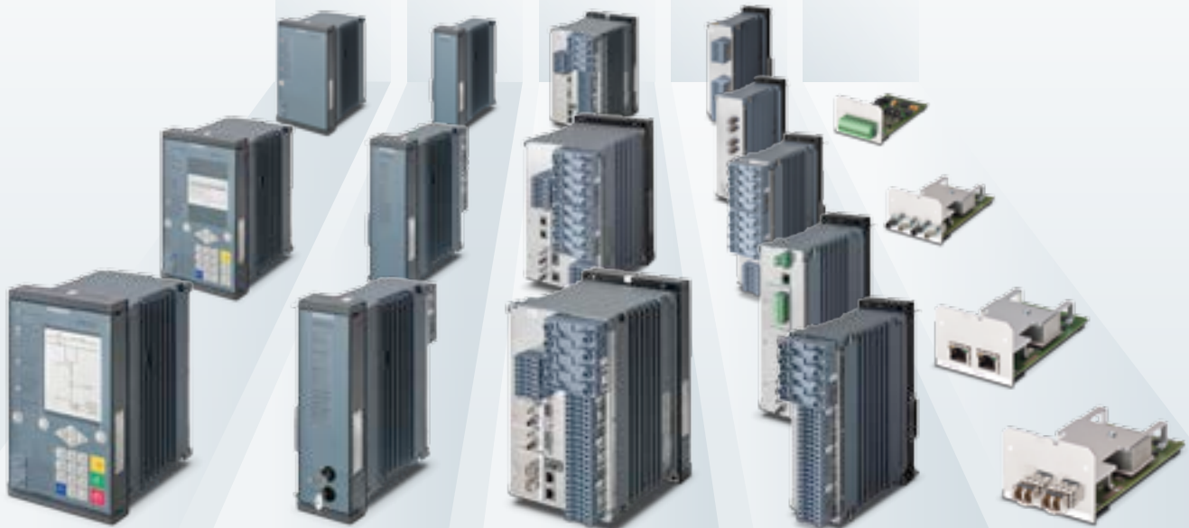
Face avant pour modules de base