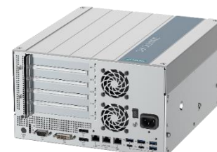
拡張 5x スロット