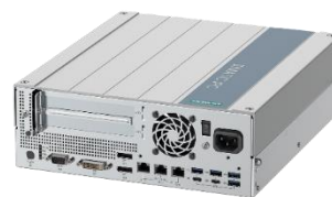
拡張 2x スロット