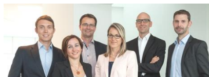
Ihr Siemens IR Team

http://www.siemens.com/investorrelations