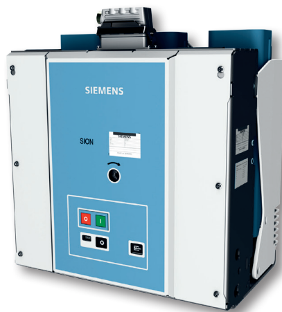
Vakuový vypínač 3AE5, SION M