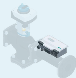
1 Dans l'axe du débitmètre