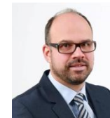
Thomas Schneider Trumpf Werkzeug- maschinen GmbH + Co. KG