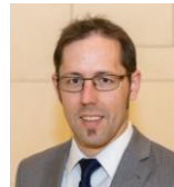
Markus Frank Grob-Werke GmbH & Co. KG