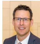
Dr. Mario Kordt Michael Weinig AG