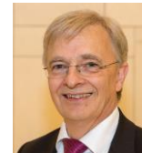
Bernhard Müller SICK AG