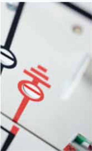
Распределительные устройства для ветряных турбогенераторов NXPLUS C Wind 36 кВ, до 25 кА, до 1000 А