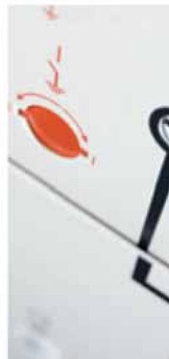
Распределительные устройства 8DJH для ветряных электростанций до 24кВ, до 20кА, до 630А до 17,5 кВ, до 25кА, до 630А