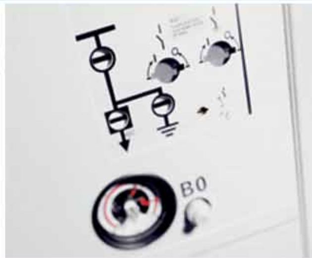
Распределительные устройства для распределительных подстанций 8DA10 до 40,5 кВ, до 40 кА, до 5000 А