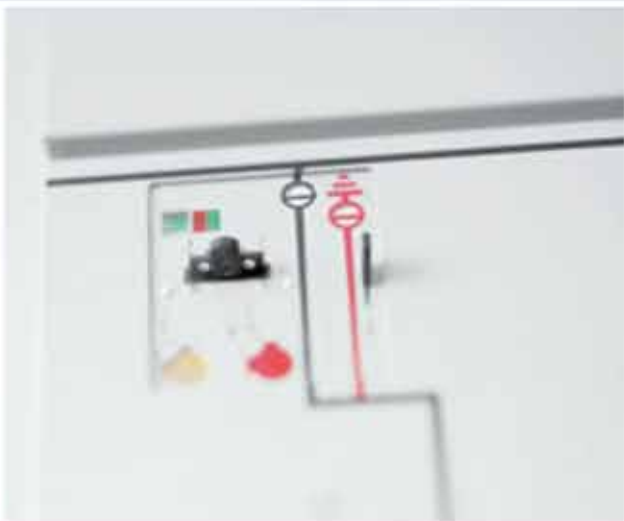
Распределительные устройства для распределительных подстанций NXPLUS C до 24 кВ, до 25 кА, до 2500 А до 15 кВ, до 31,5 кА, до 2500 А