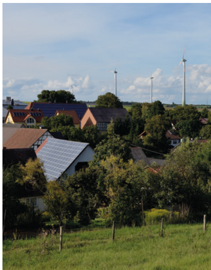
Integration erneuerbarer Energiequellen im Raum Niederstetten