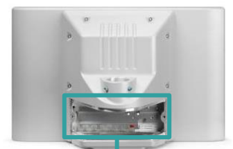
インターフェースへの 容易なアクセス