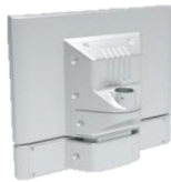
(拡張可能、ポール式)