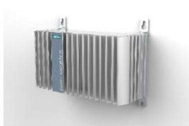
ウォールマウント