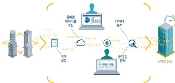
지멘스 Navigator, 클라우드 기반 에너지 및 자산 관리 플랫폼

지멘스 Navigator 클라우드 기반 플랫폼을 통해 데이터를 인터넷으로 구성할 수 있습니다. Navigator를 사용하면 보다 효과적인 운영관리가 가능하며, 에너지 절감 및 지속 가능성 목표를 달성할 수 있습니다.