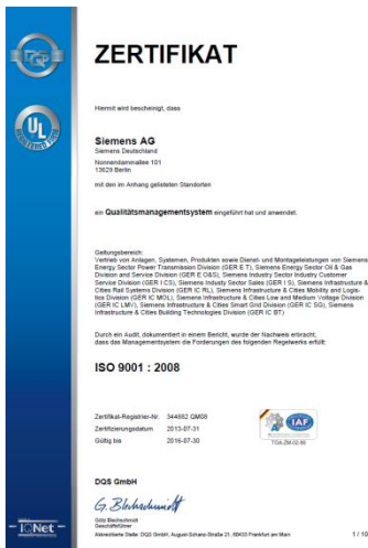
Zertifikat ISO 9001

So ist das Repair Center Hamburg sowohl nach ISO 9001 als auch nach AMS zertifiziert.