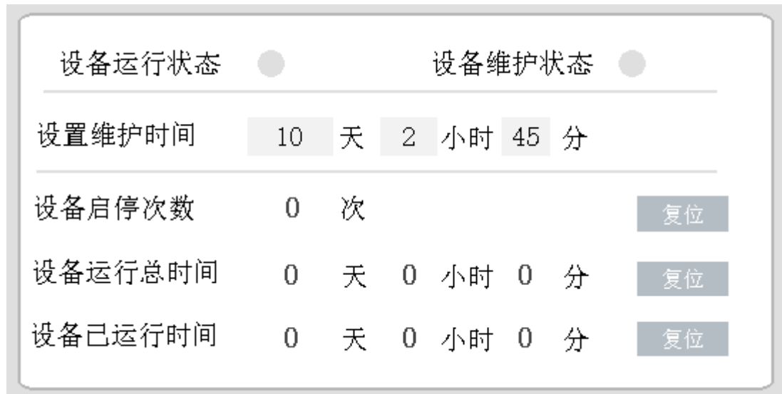
图 3 维护预警 HMI 参考画面