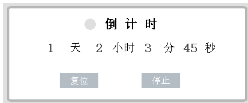
图 4 倒计时 HMI 参考画面