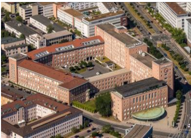
Himbeerpalast aus der Luft, Erlangen 2015