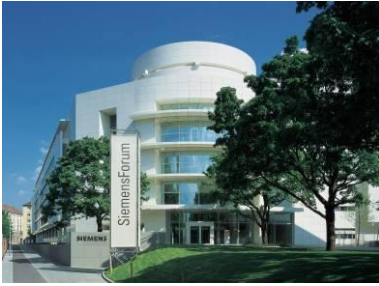
SiemensForum, München 1999

In Zusammenarbeit mit der 1994 gegründeten Siemens Immobilien Management (heute Real Estate) und dem leitenden Siemens-Architekten Gunter R. Standke entsteht ab 1997 ein um zwei Innenhöfe gruppiertes Bürogebäude für rund 1.000 Mitarbeiter. Des- sen Stahlbetonskelettbau-Konstruktion wird in den Fassaden mit weißen Aluminium-Paneelen verkleidet und erhält eine großzügig gegliederte Verglasung. Markantester Bauteil ist eine öffentlich zugängliche Rotunde, die unter anderem Ausstellungsflächen, ein Auditorium sowie ein Café-Bistro beherbergt. Die ersten Büros sind im Juni 1999 bezugsfertig; im September wird das neue Siemens-Forum als Plattform des Dialogs mit Öffentlichkeit und Kunden er- öffnet. Im Zuge der Neugestaltung der Münchener Zentrale wird das SiemensForum 2013 verkauft und bis 2016 zurückgemietet.