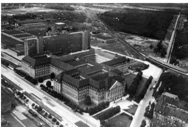
Luftaufnahme des Verwaltungsgebäudes, Berlin 1930