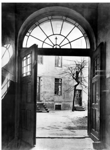
Durchblick zur ersten Werkstatt von Siemens & Halske, Berlin undatiert

1969 konstatierte der damalige Aufsichtsratsvorsitzende Ernst von Siemens: „Was die Öffentlichkeit von uns denkt, wie sie uns beurteilt und einschätzt, hängt auch in starkem Maße von der Gestalt unserer Bauten ab.“ Mit dieser Aussage identifizierte er die, im heutigen Sprachgebrauch, Corporate Architecture als festen Bestandteil der Unternehmensidentität. Aus Anlass der Eröffnung des neuen Headquarters in München haben wir eine Bilderstrecke zu den Verwaltungsgebäuden von Siemens zusammengestellt.