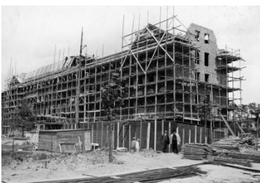
Arbeiten am ersten Bauabschnitt, Berlin 1910