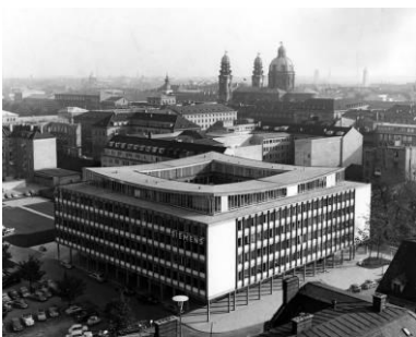
Verwaltungsgebäude am Oskar-von-Miller-Ring, München 1958