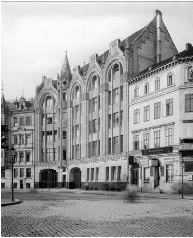
Verwaltungsgebäude am Askanischen Platz, Berlin um 1903