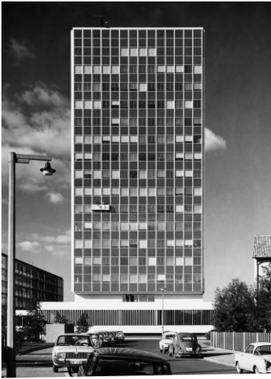
Der Glaspalast, Erlangen 1962