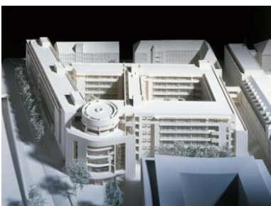
Modell SiemensForum, München 1997

Das Palais am Wittelsbacherplatz 2 ist Firmensitz und Sinnbild der 1966 gegründeten Siemens AG. Lange Jahre befindet sich der Haupteingang an der zum Odeonsplatz hin ausgerichteten Ostseite des Gebäudes. Erst 1968 wird an dessen Südseite nach einem Entwurf Hans Maurers eine Freitreppe errichtet, durch die die Fassade zum Wittelsbacherplatz ihr heutiges Erscheinungsbild erhält. Weitere zehn Jahre später wird der Platz umgestaltet: Aus einem Parkplatz wird eine Fußgängerzone, die den innerstädtischen Fußgängerbereich abschließt.