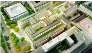
Entwurf von Henning Larsen Architects, 2011