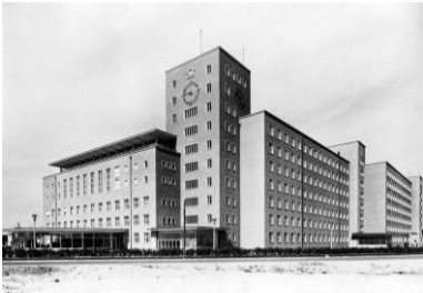
Himbeerpalast, Erlangen 1953