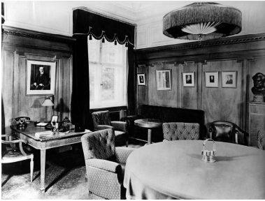
Vorstandsbüro, Berlin 1920er Jahre