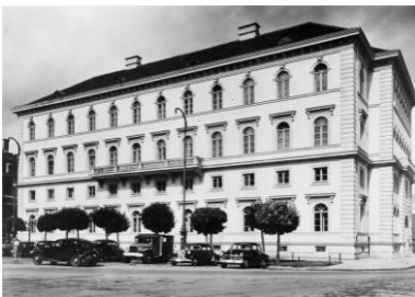
Palais Ludwig Ferdinand, München 1949

Ende 1913 ist der zweite Bauabschnitt nahezu fertiggestellt und die in der Berliner Innenstadt beschäftigten Verwaltungskräfte beginnen, an den Nonnendamm umzuziehen. Bereits nach wenigen Monaten arbeiten rund 3.000 Menschen in dem mehrflügeligen Geschossbau. Die meisten Arbeitsplätze befinden sich in sogenannten Bürosälen für bis zu 100 Personen. Komfort und Einzelzimmer sowie Räume mit gediegener Ausstattung bleiben dem Vorstand, der Direktion, den Bevollmächtigten und Prokuristen sowie dem Besucherempfang vorbehalten.