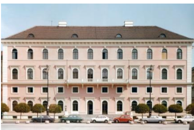
Palais Ludwig Ferdinand, München 1978