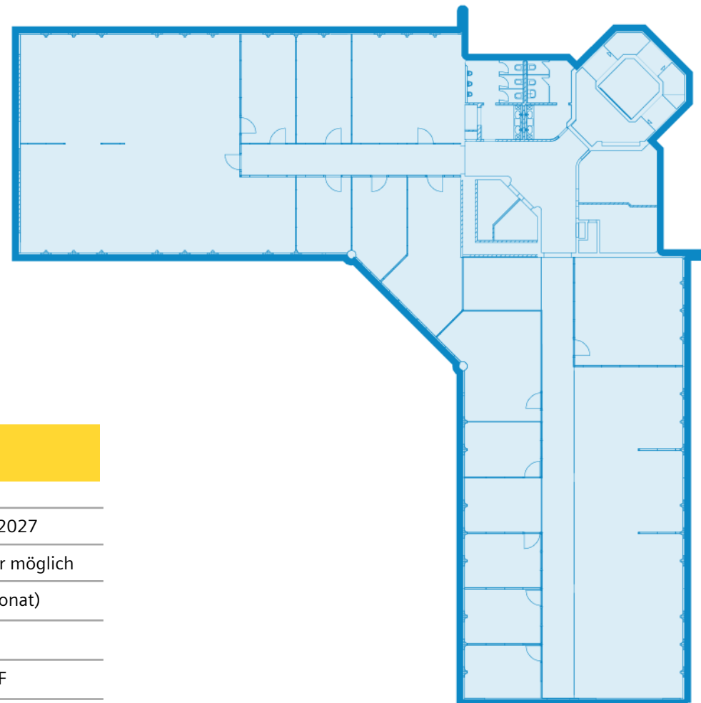
Beispielhafter Grundriss – 2.OG

Kostenlose Beratung bei Raum- und Flächenplanung sowie bei Umbaumaßnahmen