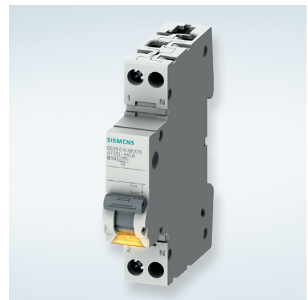
Detectores de Arco 5SV6 con Int. Automático en un 1 Módulo

En combinación con los Detectores de Arco 5SM6, se obtiene una protección total en tan sólo 2 módulos.