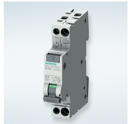
Interruptor Automático + Diferencial 5SV1 en 1 Módulo