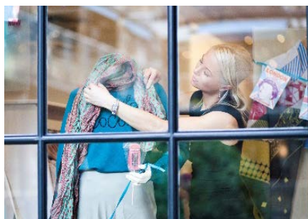
Einkaufszentren und vielen weiteren Gebäuden.