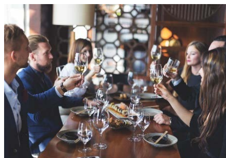
Restaurants und Hotels