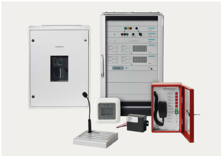
Novigo 19 Zoll System und Novigo Core

Das Novigo 19 Zoll System und Novigo Core sind vollständig kompatible Systeme, die genau auf die Bedürfnisse Ihres Gebäudes zugeschnitten werden können. Sie decken eine Vielzahl von Lautsprecherlinienoptionen ab, wie Loop, Stichleitung, doppelte Stichleitungen (A/B-Leitungen) oder Baumstrukturen, und sind konform mit allen normativen Anforderungen. Mit adressierbaren End-of-Line-Modulen