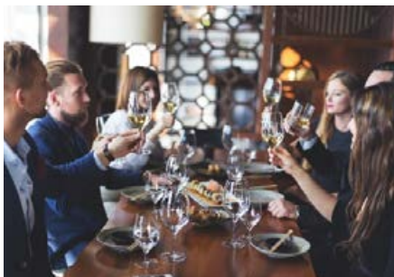
Restaurants und Hotels