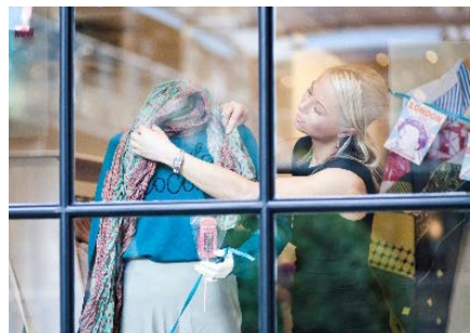
Einkaufszentren und vielen weiteren Gebäuden.