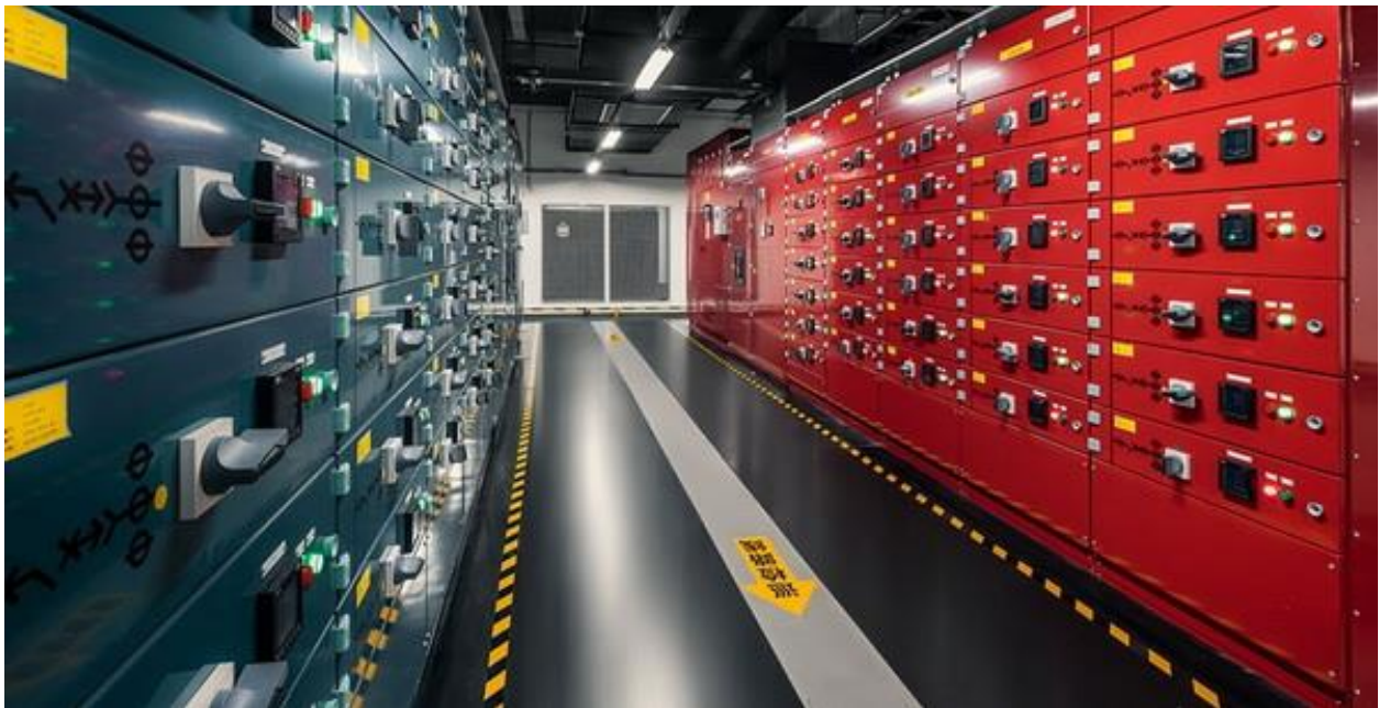
（图片：阿里巴巴张北数据中心内的西门子配电设备）

集结了数十万台服务器的数据中心不仅是互联网的基石，也是“云”的物理实体。在那里，数据被传输、处理、存储，经年累月，昼夜不息。为了降低能耗、节省电费开支，张北数据中心的运维团队采取了很多措施去改善能源使用效率（PUE）。