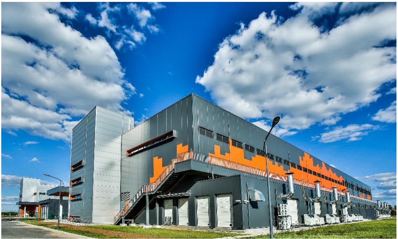
(图：阿里巴巴张北数据中心)

种了一整年的“草”，必须在第一时间拔掉！“双 11”零点将至，你是不是也抱着手机严阵以待，随时准备着清空购物车？其实，在时间归零的一霎那，世界各地还有上亿人和你一样，果断点下了付款按钮。此时，感觉到压力山大的除了你的钱包，还有天猫背后的数据中心。