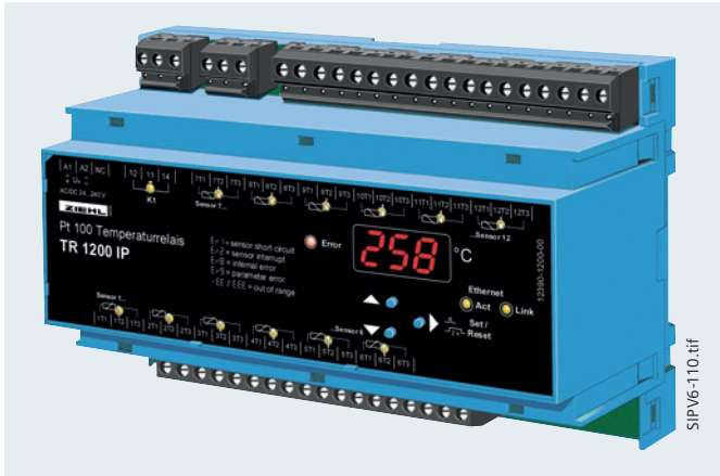
Abb. 13/113 Thermobox TR1200 IP (Ethernet) 7XV5662-8AD10