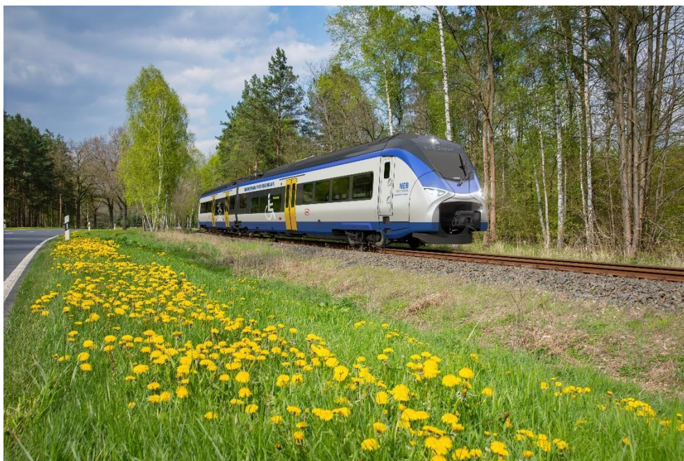
Siemens Mobility Mireo Plus B Netz Ostbrandenburg

Diese Presseinformation sowie Pressebilder und weiteres Material finden Sie unter https://sie.ag/3wGcDoX