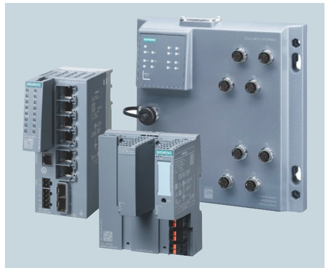
SCALANCE X-Produkte zum Einsatz in der Prozessindustrie

Jeder Switch SCALANCE XF-200BA unterstützt bis zu vier Ports mit 100 Mbit/s. Um die Anzahl der Broadcasts im Netzwerk zu minimieren, teilen beispielsweise virtuelle LANs (VLANs) das physikalische Netzwerk in virtuelle Bereiche auf. Eine hohe Verfügbarkeit von Maschinen und Anlagen bieten Redundanzprotokolle wie das HRP-Protokoll (Highspeed Redundancy Protocol) und das MRP-Protokoll (Media Redundancy Protocol). Mit diesen Protokollen erfolgt im Fehlerfall die Umschaltung auf den redundanten Pfad ohne Ausfall der Kommunikation. Diese und weitere Funktionen wie RMON (Remote Networking Monitoring) und Link Aggregation runden das Firmware-Spektrum ab.