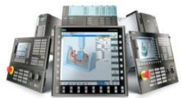
SINUMERIK Werkzeugmaschinen-Steuerung (CNC)

Wir implementieren Digitalisierung und flexible Automatisierung erfolgreich. Das GWE präsentiert sich als hervorragendes Beispiel mit digitalen Zwillingen zu jedem Schritt in der digitalen Wertschöpfungskette.