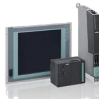
SIMOTION Motion Control Systeme