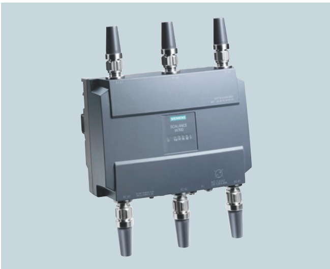
Robuster Access Point, Variante für besondere Umwelthanforderungen und den Einsatz in Bus und Bahn

Um schnellstmöglich defekte Komponenten austauschen und wieder in Betrieb nehmen zu können, ist es sinnvoll, auch die Aggregationsnetzwerke, wie den Industrial Backbone, direkt an der Anlage zu platzieren und so den Serviceweg und die Reaktionszeit gering zu halten. Die Umgebungsbedingungen in einer Fertigung, einer Verteilerstation oder an einer Ab- oder Umfüllanlage unterscheiden sich signifikant von den Klimabedingungen im Rechenzentrum oder Büro. Dass hierfür robuste Komponenten verwendet werden sollten, für die es auch nach Jahren noch Ersatz gibt, versteht sich ebenfalls von selbst.