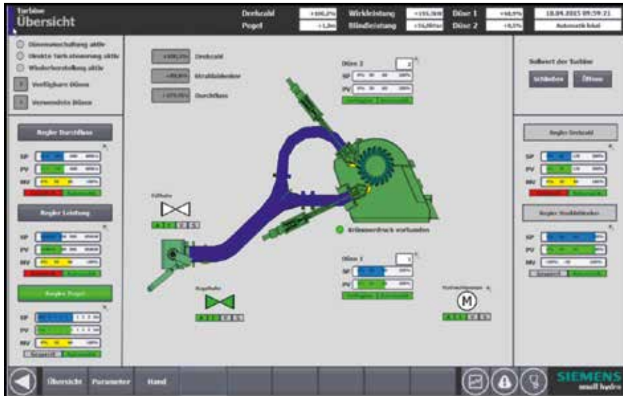
Vista geral de uma turbina Pelton de dois bocais com válvula de entrada. Todos os valores de referência relevantes, valores de parâmetros e valores atuais são indicados e estão acessíveis. Os estados do controlador da turbina são exibidos, como o controlo de caudal, o controlo de potência e o controlo de nível, sendo possível seleccionar os modos de operação permitidos.