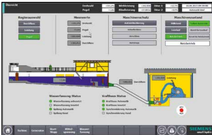
Vista geral de uma pequena central hidroelétrica de uma unidade. Os dados medidos relevantes são indicados para a operação da central. Os modos de operação, a seleção do controlador ativo e o estado de proteção da unidade estão dispostos e representados de forma clara.