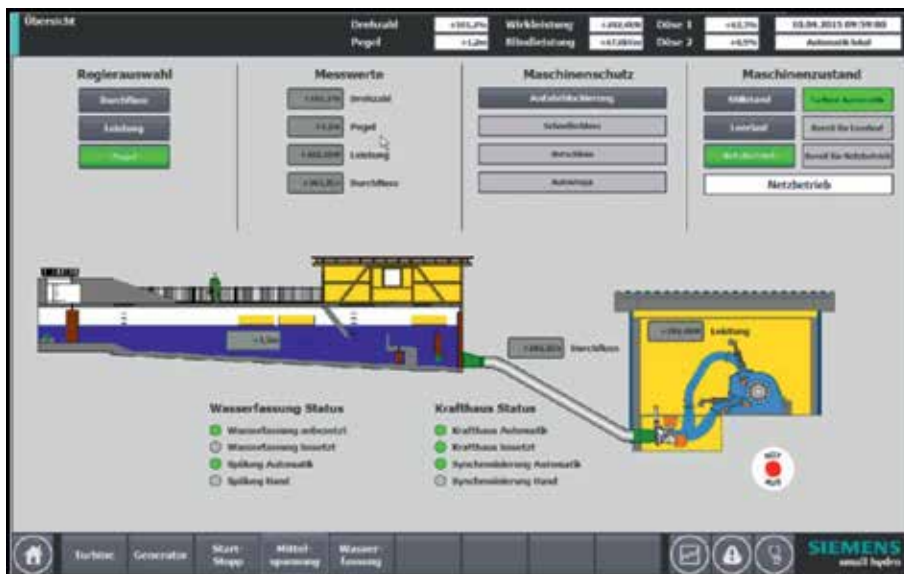
Обзор малой гидроэлектростанции с одним модулем (скриншот). Отображаются результаты измерений при работе электростанции. Также выводится и отображается информация о режимах работы, выбранном активном контроллере и состоянии защиты модуля.