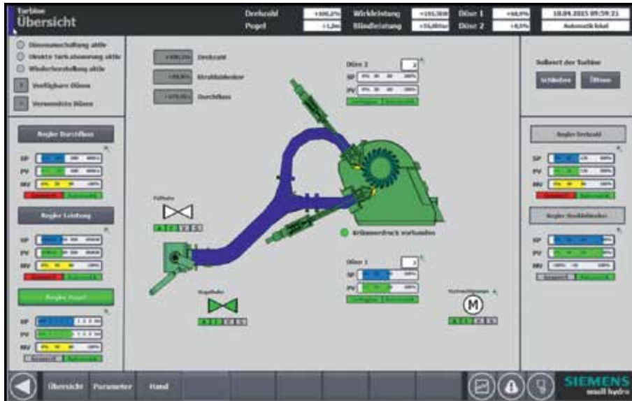
Обзор турбины Пельтона с двумя форсунками и впускным клапаном (скриншот). Все важные уставки, значения параметров и текущие значения показаны и доступны. Отображаются статусы контроллера турбины, можно выбрать управление потоком, мощностью, уровнем, а также возможные режимы работы.